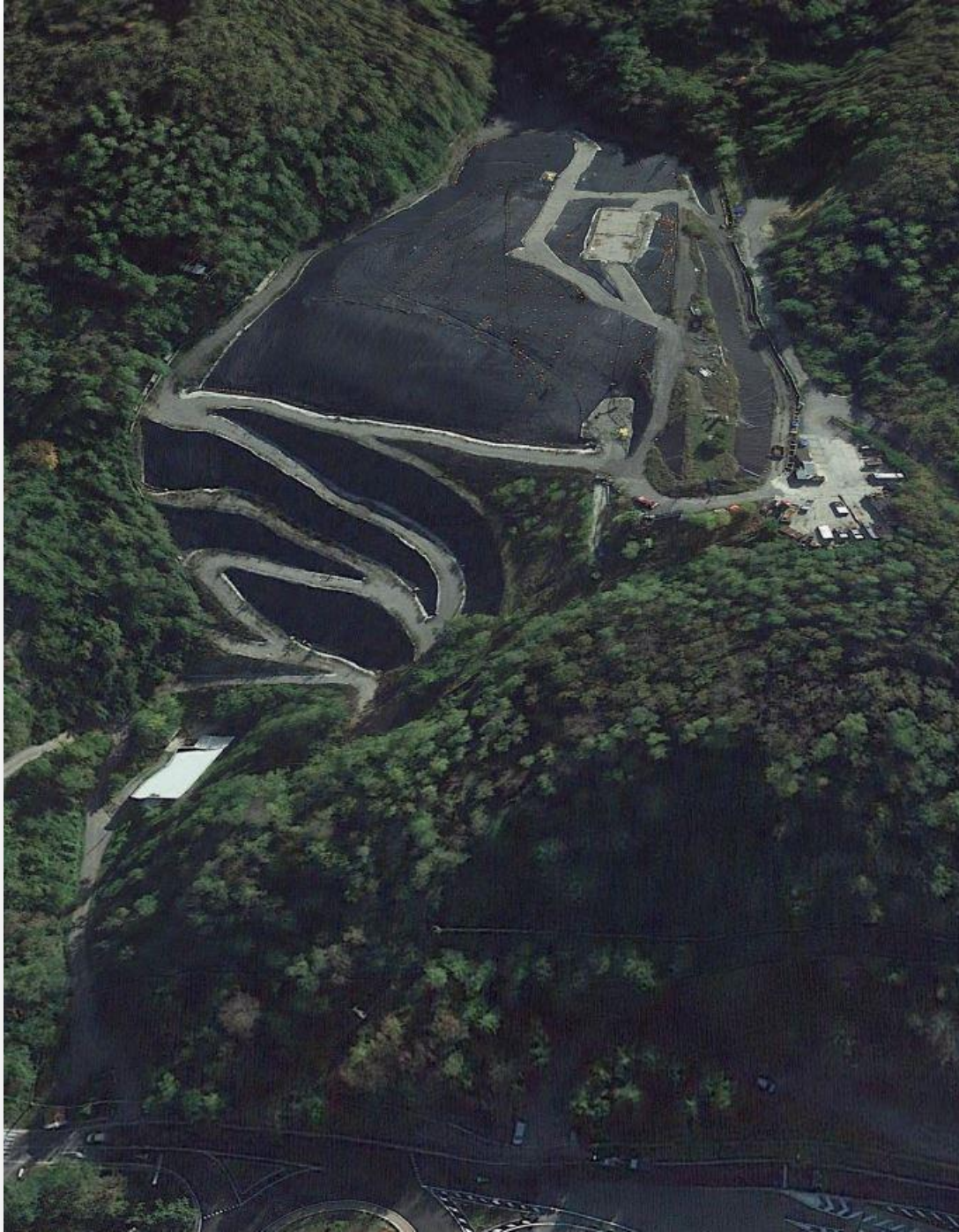
Figura 1: vista 3D da Google Earth, discarica in località Birra